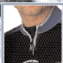
РАССЛАБЛЯЮЩАЯ ВОРОТ МОЛНИЯ