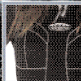
ОБЪЕМНЫЙ КРОЙ, ПОДЧЕРКИВАЮЩИЙ ЛИНИИ