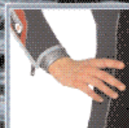
КОМФОРТНЫЕ ЭЛАСТИЧНЫЕ ОБТОРАТОРЫ